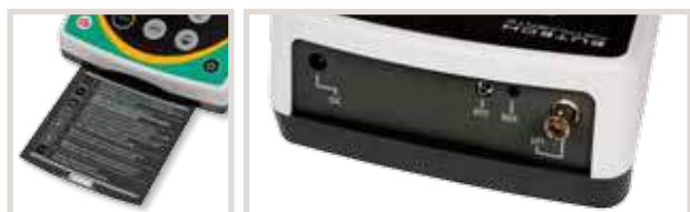
scheda istruzioni estraibile

Elettrodo combinato, testa a vite S7. Corpo in vetro per usi generali. Dimensioni (LxØ) mm 120x12, membrana cilindrica. Riempimento a polimero senza setto poroso. Per una risposta veloce con elevata precisione in campioni che possono contaminare i normali diaframmi. Esente da manutenzione. pH 0...14, temperatura -10...80 °C.