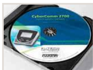
Software di gestione gratuito disponibile sul sito www.giorgiobormac.com