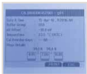
Messaggi informativi per una semplice operatività senza problemi

Elettrodo combinato, testa a vite S7. Corpo in vetro per usi generali. Dimensioni (LxØ) mm 120x12, membrana cilindrica. Riempimento a KCl con setto poroso. Per una risposta veloce con elevata precisione. Per usi generali. Esente da manutenzione. pH 0...14, temperatura -10...100 °C.