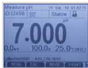
Display con indicatore di stabilità per eliminare sorprese