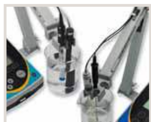
Portaelettrodo integrato, può essere usato su entrambi i lati